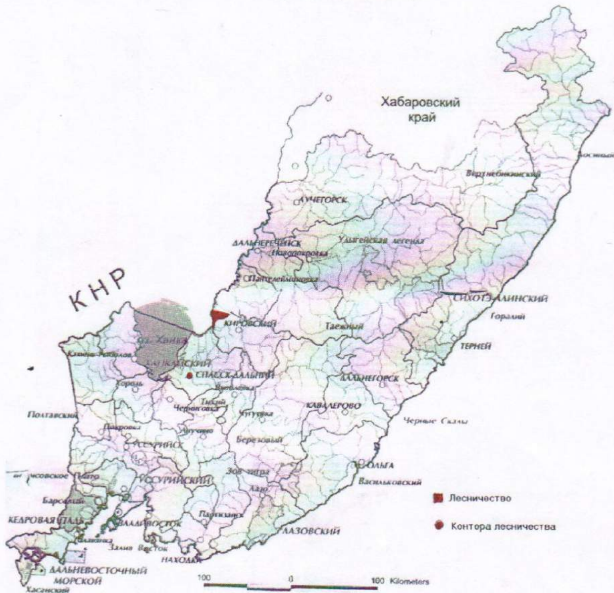
Карта – схема расположения лесничества «Государственный природный заповедник «Ханкайский» на территории Приморского края